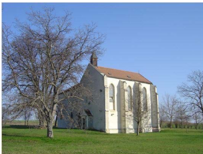
A sopronkertes (baumgarteni) Pálós kolostor-templom, (Fotó: internet)

Indulás: 2010. Május 22-én (szombaton) 13.30 órakor